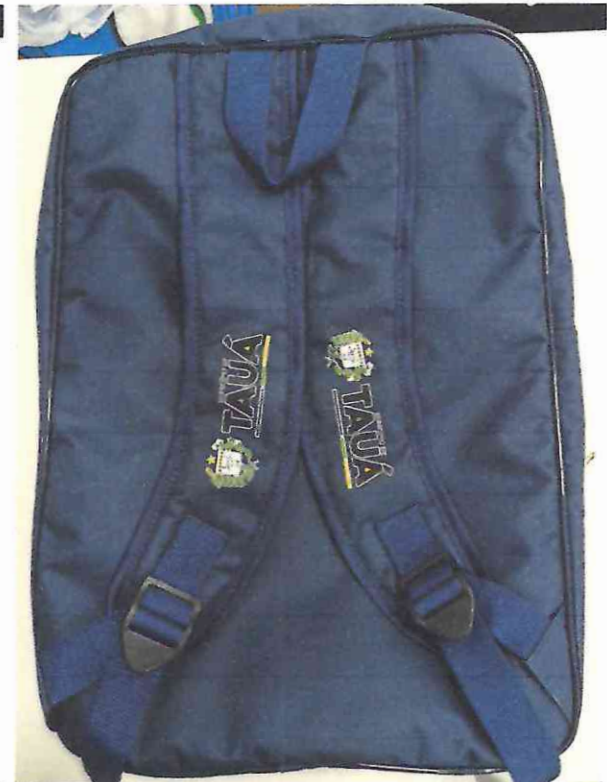
MOCHILA DO ENSINO FUNDAMENTAL APROVADA SEM RESSALVA