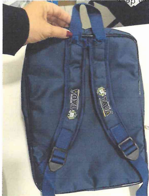
ALÇA DA MOCHILA DA EDUCAÇÃO INFANTIL QUE SOLTOU APÓS SER PUXADA.