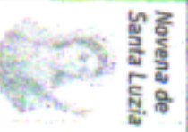
Novena de Santa Luzia

Serviço de Apoio às Menas e Pequenas Empresas do Estado do Ceará - SEBRAE/CE AVISO DE CHAMAMENTO PÚBLICO Modalidade: CHAMAMENTO PÚBLICO Nº. 001/2023 - Destinado a entidades privadas filantrópicas ou beneficentes sem fins lucrativos localizadas no âmbito do biotopo/CE. Objeto: O presente CHAMAMENTO PÚBLICO tem por objetivo o DOAÇÃO de bens móveis destinados a serem utilizados na composição de Cestas Básicas para Concessão de Benefício Eventual destinadas às famílias. Usuários em Situação de Vulnerabilidade Socioeconômica, e, ou Situação Emergencial atendidas, acompanhadas pela Rede Socioassistencial do Sistema Único de Assistência Social - SUAS, que dispõe sobre a Política Municipal de Assistência Social no Município de Erebé, estabelecido na Lei Municipal 387/2017 de 15/12/2017, conforme as especificações e quantidades constantes no Termo de Referência. TIPO: Menor Preço por Lote. FORMA DE DISPONIBILIZAÇÃO: Aberto e Fechado. Comissão de Pregão comunica aos interessados que a entrega das propostas comerciais dar-se-á até o dia 13/03/2023 às 08:00 horas (horário de Brasília). O edital e seus anexos estão disponíveis através dos sites: https://alcompras.com/Home/Publicacoes Acesso identificado no link - acesso público e www.tce.ce.gov.br . A comissão.