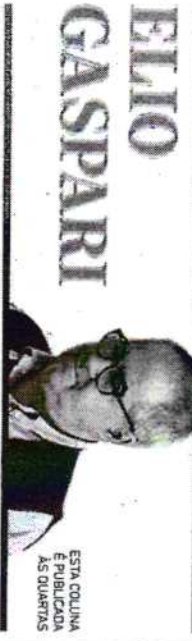
ESTA COLUNA É PUBLICADA AS QUARTAS