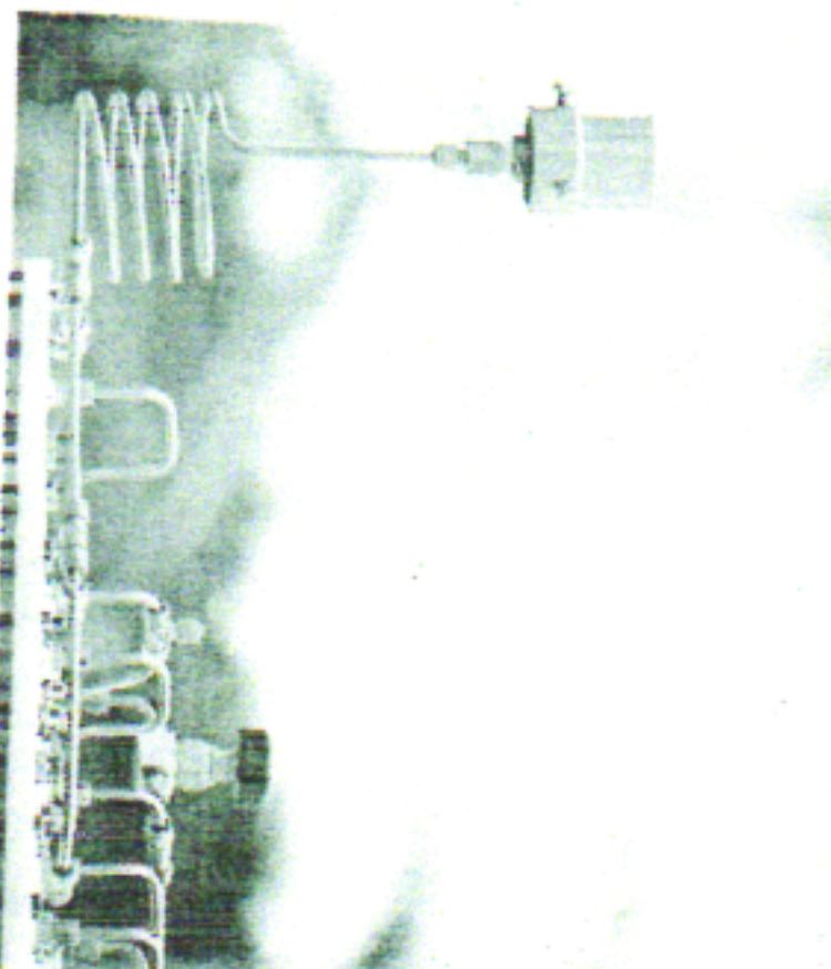
NO PECÉM, Ceará, já é produzido hidrogênio verde em caráter experimental

nas demais energias renováveis – como a eólica e solar.